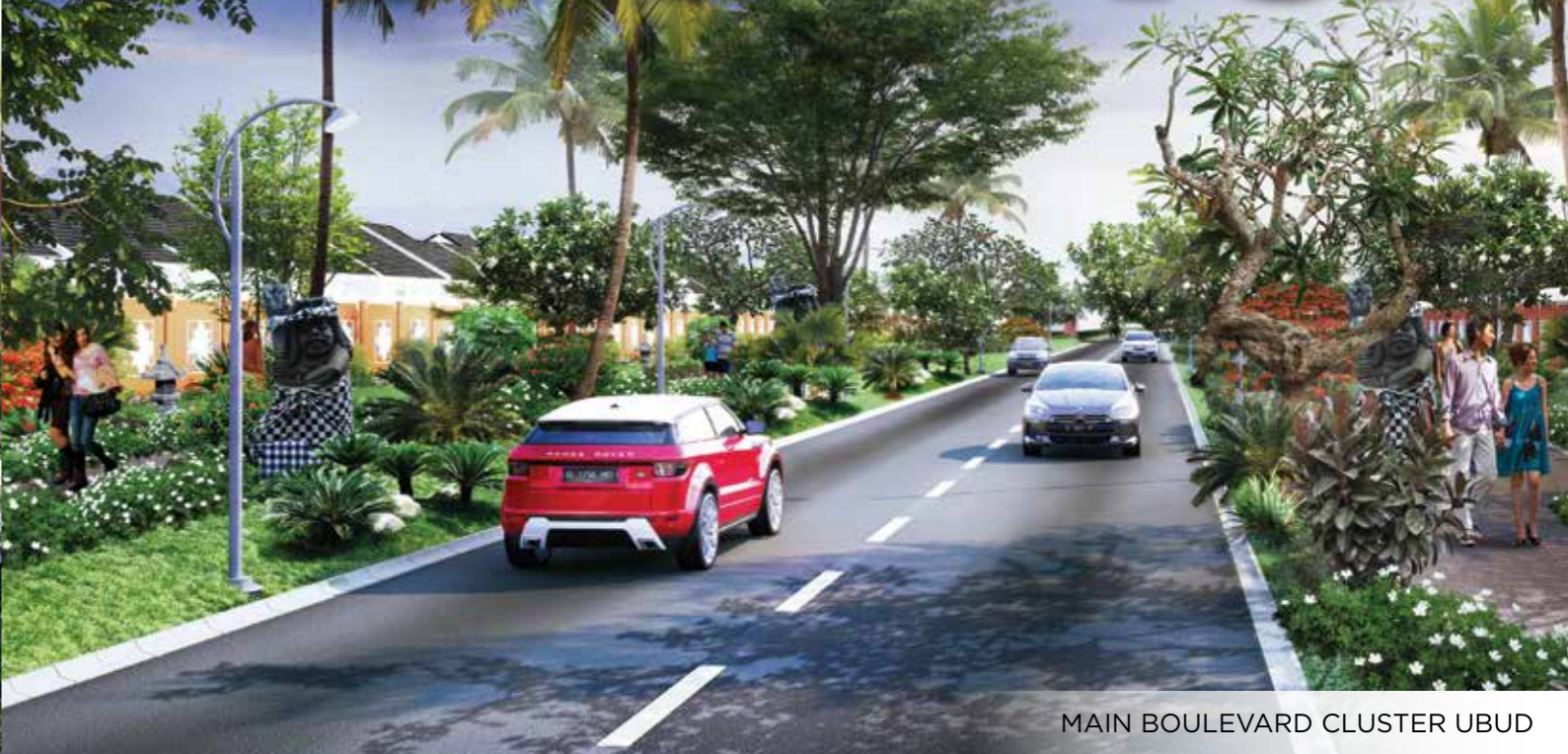
MAIN BOULEVARD CLUSTER UBUD