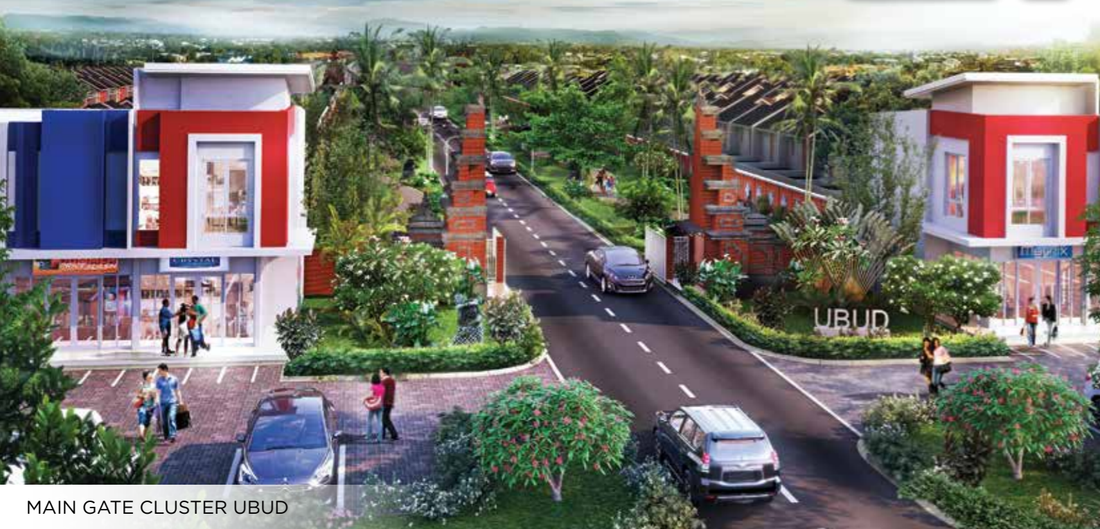
MAIN GATE CLUSTER UBUD